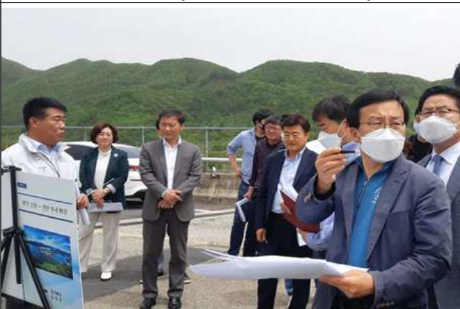
예타 현장 설명 사진(2020. 5. 14.)