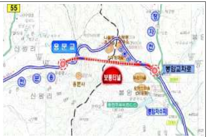
평 면 도